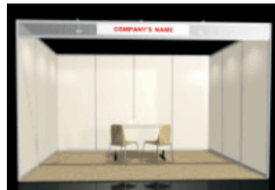
Περίπτερο 1 όψης

Το περίπτερο δομής δεν περιλαμβάνει έπιπλα.